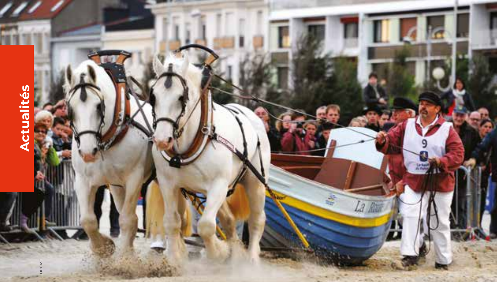
Des Boulonnais lors de la traditionnelle épreuve du Flobart