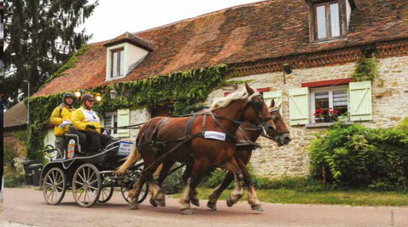
L'équipe Trait de Bourgogne... et sa paire de chevaux Comtois lors de l'édition 2012 de la Route du Poisson