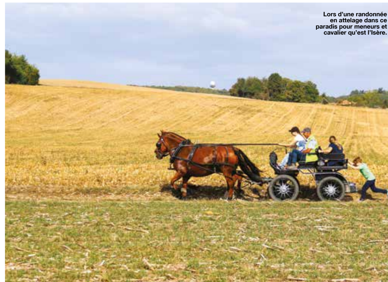
Lors d'une randonnée en attelage dans ce paradis pour meneurs et cavalier qu'est l'Isère.