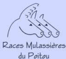
Illustration © SEET