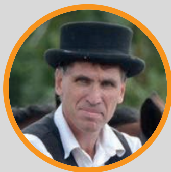
Denis Beaumelle Les Attelages de la Bièvre