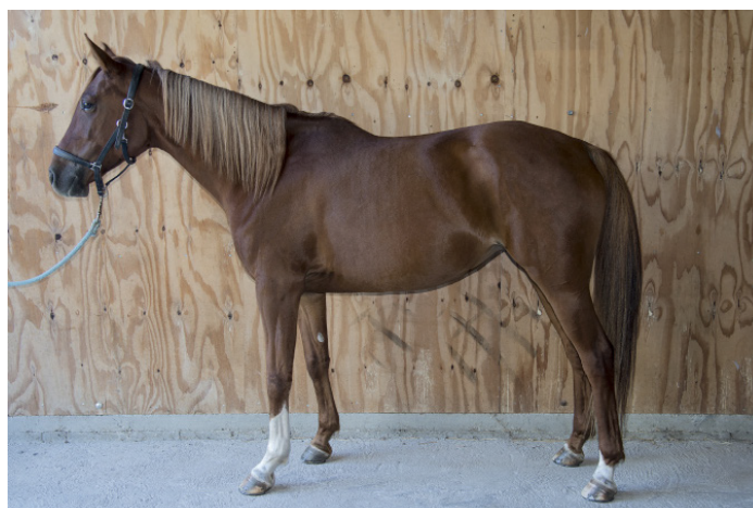
Photo de profil gauche de votre cheval.