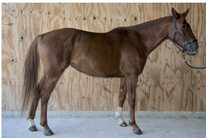
Photo de profil droit de votre cheval.