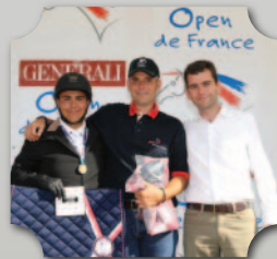
OPEN DE FRANCE 2015 CSO CLUB 1 MÉDAILLE DE BRONZE