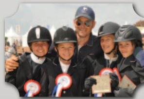
OPEN DE FRANCE 2013 8 ÈME PLACE ÉQUIPE