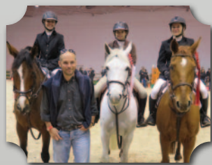
EQUITA CLUB CUP EQUITA LYON 2015 MÉDAILLE D'ARGENT