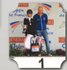
CHAMPIONNE DE FRANCE HUNTER MINIMES 2014