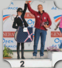
OPEN DE FRANCE 2015 HUNTER CLUB 2 MÉDAILLE D'ARGENT