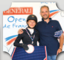
OPEN DE FRANCE 2016 HUNTER CLUB 1 MÉDAILLE D'ARGENT