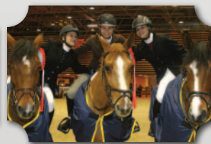
EQUITA CLUB CUP EQUITA LYON 2013 MÉDAILLE D'OR