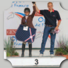
OPEN DE FRANCE 2015 HUNTER CLUB 1 MÉDAILLE DE BRONZE