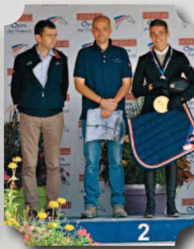
OPEN DE FRANCE 2017 HUNTER CLUB 1 MÉDAILLE D'ARGENT