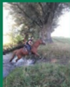
Cover : C. Dartevelle