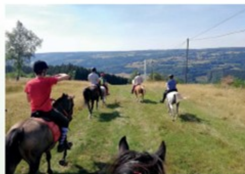
Rando ados Manu Moxhet

Les randonneurs de ces deux derniers groupes auront l'occasion de :