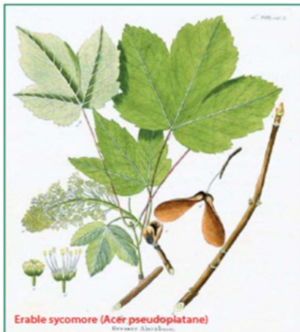
Erable sycomore ( Acer pseudoplatane )