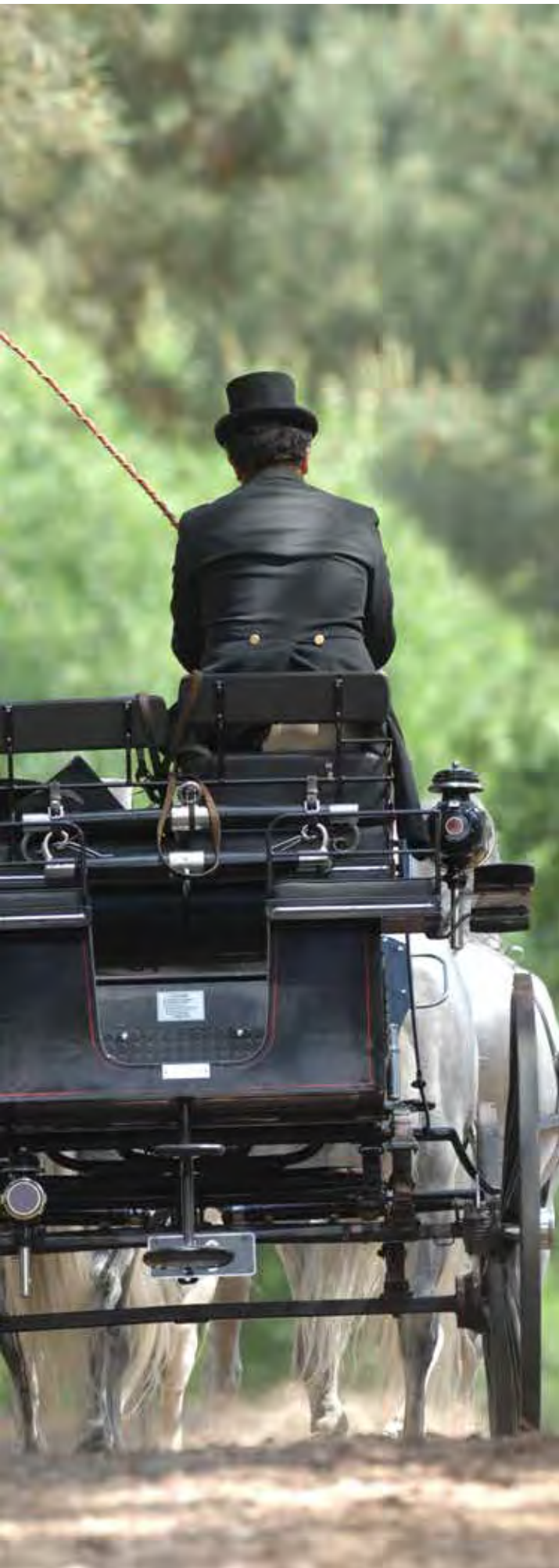
Attelage de tradition

« Du patrimoine à la modernité, une histoire de transfert » : tel est le titre de ce dossier de presse qui illustre ce que l'IFCE développe à Uzès :