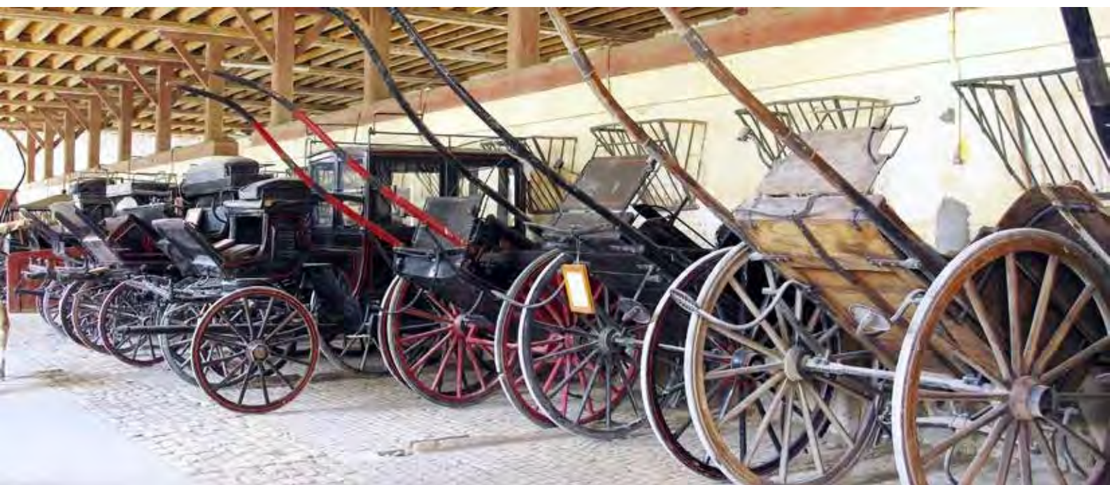
Environ 300 véhicules hippomobiles sont recensés par l'IFCE

Mentionné explicitement parmi les objectifs stratégiques de son contrat d'objectifs et de performance (COP) 2018-2022, l'IFCE doit s'assurer que la filière et ses ayants droit pluriels pourront bénéficier de toutes ces richesses. Il convient pour se faire d'associer les compétences nécessaires, notamment le ministère en charge de la culture, pour élaborer et mettre en œuvre des actions concrètes et utiles aux acteurs du monde équestre.